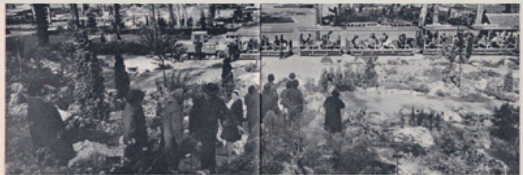
ORLEANS: LE PLUS GRAND BOUQUET DU MONDE