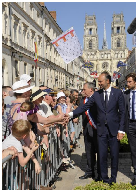
Edouard Philippe en 2018