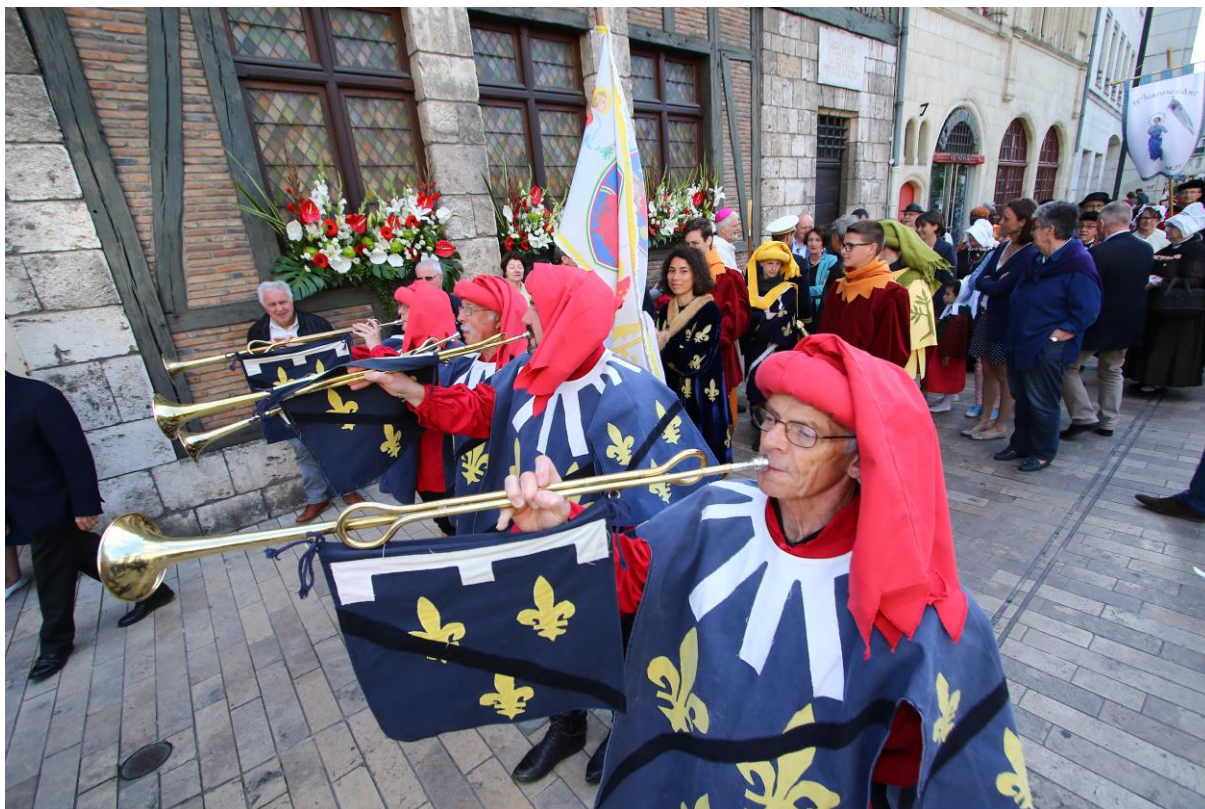
Fêtes de Jeanne d'Arc 2018