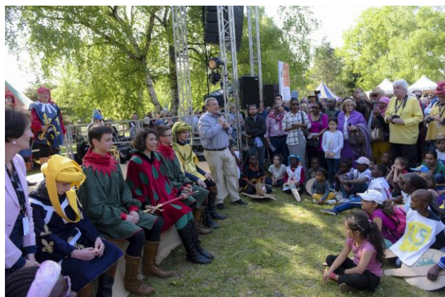
Orléans La Source fête Jeanne d'Arc 2018