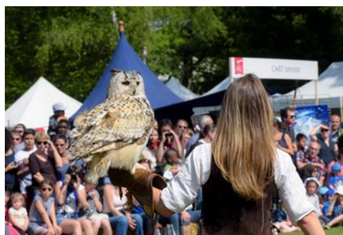
Orléans La Source fête Jeanne d'Arc 2018

Les origines de la fauconnerie remontent à près de 4000 ans, touchant tous les continents et pratiquement toutes les civilisations. En France, elle a connu son apogée au Moyen-Âge... Trois spectacles créés et réalisés par « Vol en Scène » sont proposés avec vautour, aigle, faucon, chouette, etc.