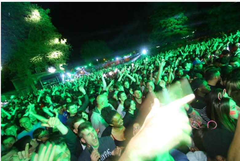
Edition Set Electro 2016