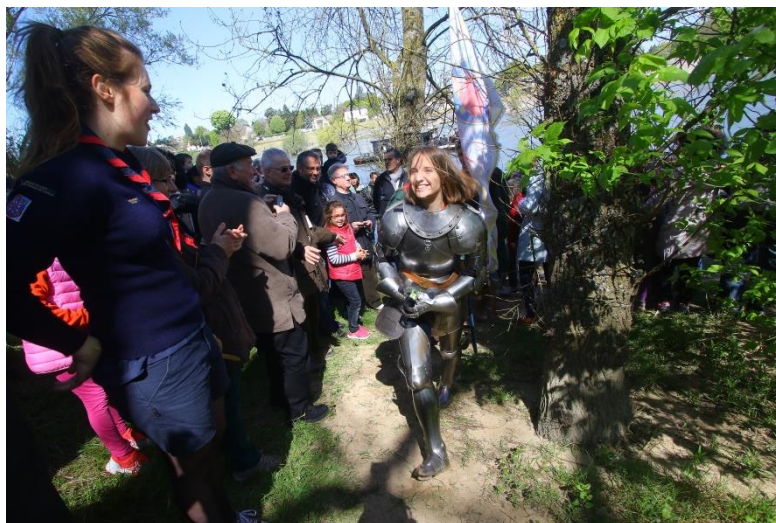
Edition Fêtes de Jeanne d'Arc 2016

Avec la participation de la Musique Municipale d'Orléans, de l'harmonie de Saint-Marc Saint-Vincent et de l'association « Sainte Jeanne, hier, aujourd'hui et demain ».