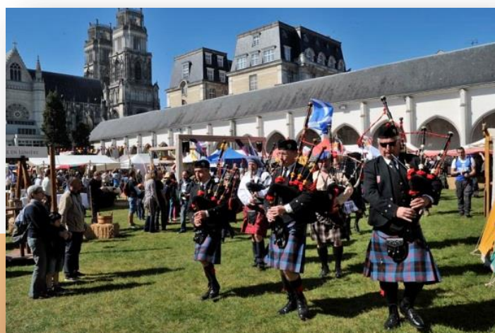
Edition Fêtes de Jeanne d'Arc 2016