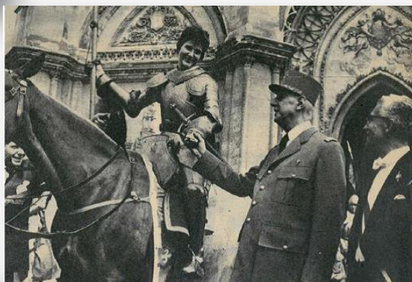
Le Général de Gaulle en 1959