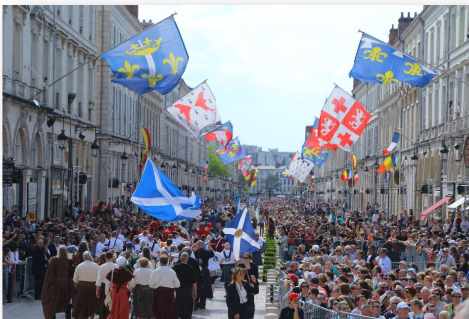
Edition Fêtes de Jeanne d'Arc 2016

Avec la participation exceptionnelle de la Fanfare de la Cavalerie de la Garde Républicaine.