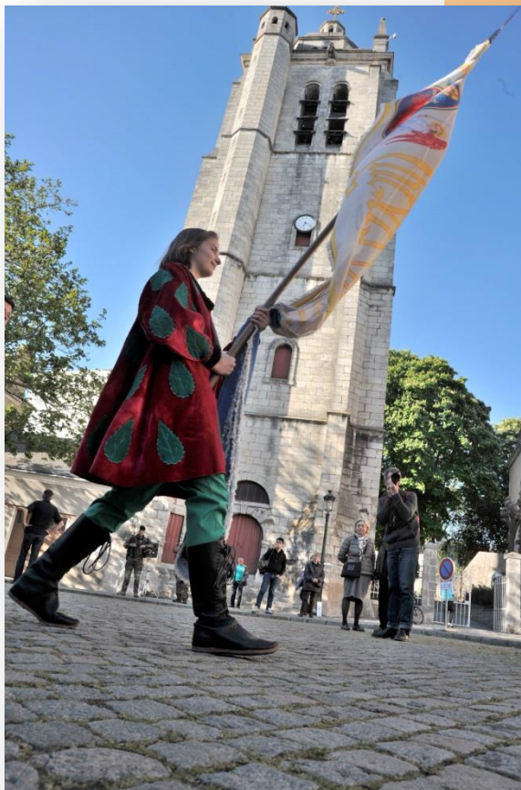
Edition Fêtes de Jeanne d'Arc 2016

18h30 : Office religieux Eglise Notre Dame des Miracles - 3 rue Cloche Saint-Paul