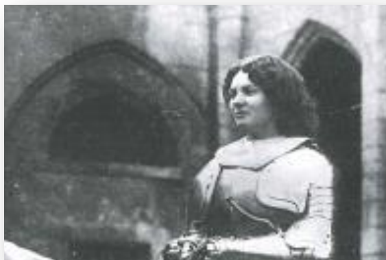
Edition Fêtes de Jeanne d'Arc 1912