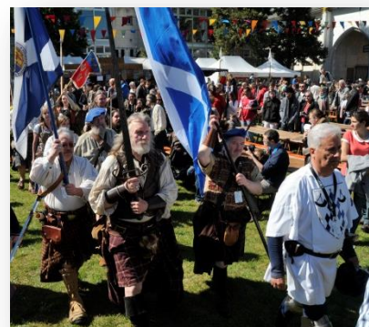
Edition Fêtes de Jeanne d'Arc 2016

*proposée pas les Compagnies : Corazon, Les Colporteurs de Couleurs, Les Pies, La Muse et Les Mandalas.