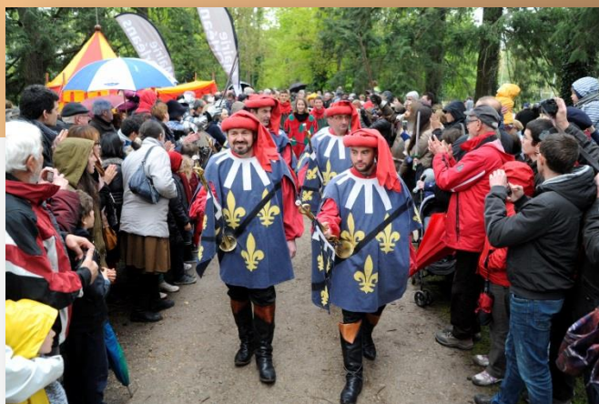
Edition Orléans La Source fête Jeanne d'Arc 2016