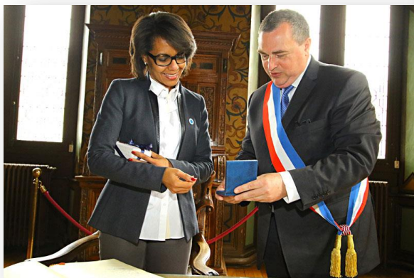
Audrey Pulvar en 2015