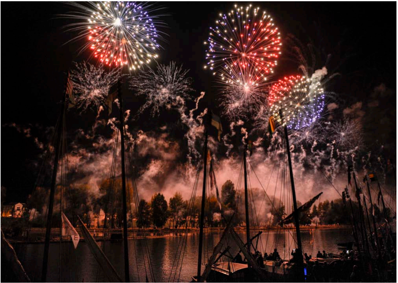
FEU D'ARTIFICE