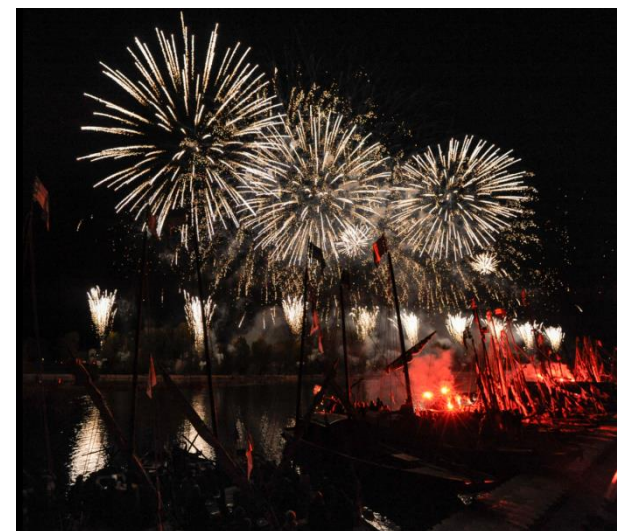
Spectacle pyro-musical 2017

De la musique, des bateaux, des mariners... et une explosion d'artifices ! Embarquez pour un voyage extraordinaire chez nos voisins d'outre-Manche, de la Reine d'Angleterre à James Bond ! Ce spectacle décoiffant, imaginé sous la direction d'Andréa Scarpato de la société Pyroémotions, est une création unique conçue exclusivement pour le Festival de Loire 2019.